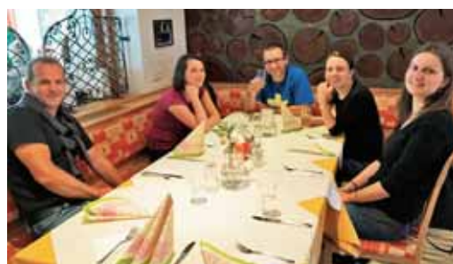
Težko pričakovano kosilo.