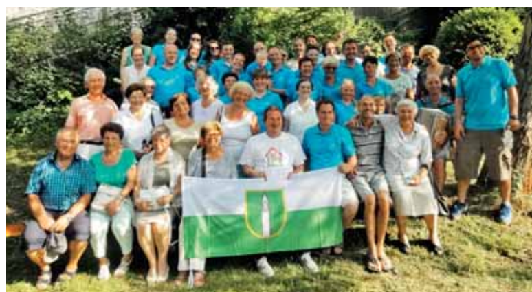
Obisk Šentviških slavčkov v Stuttgartu