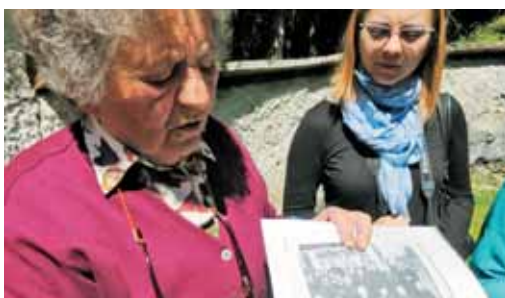
Ga. Majda je pokazala tudi ohranjene fotografije.