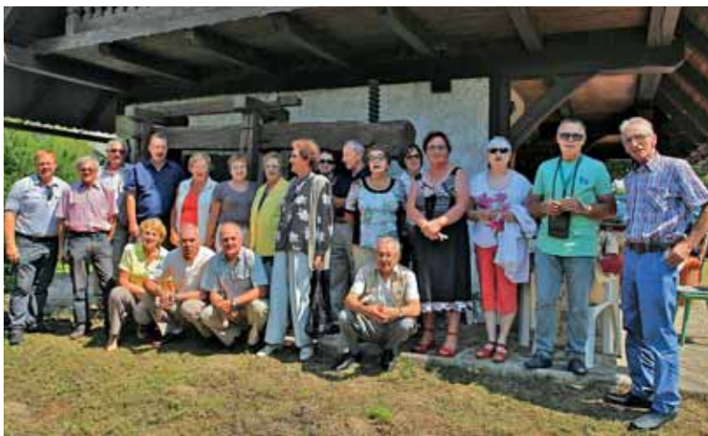
V senci stare gradiške preše se rojeva sveža pesem in pristno prijateljstvo.