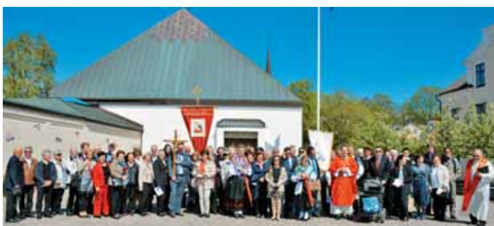
Romarji za binkošti k sv. Brigiti v Vadsteno