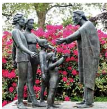
Jezus sprejema družino - Heppeneert 2015

V pripravi družinskega dne in praznika prvega svetega obhajila v mesecu juniju je odigrala pomembno vlogo slika, ki je bila narejena na binkoštnem romanju v Marijini romarski cerkvi v Heppeneertu (bin-