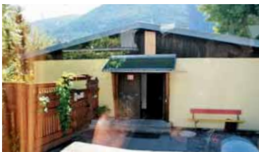
Še vedno ohranjena baraka v Lienzu.