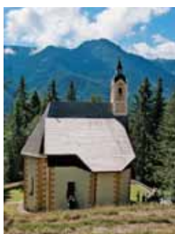
Cerkev v Anrasu, kjer so imeli begunci slovensko mašo.