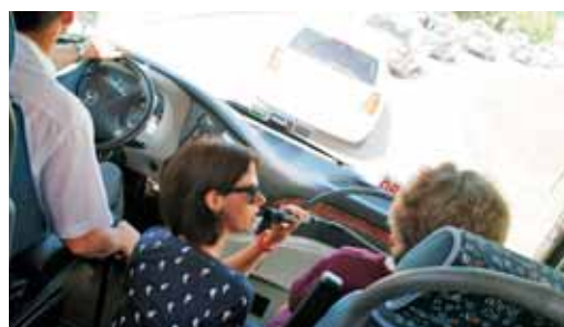
Na avtobusu so se porajala tudi vprašanja udeležencev.