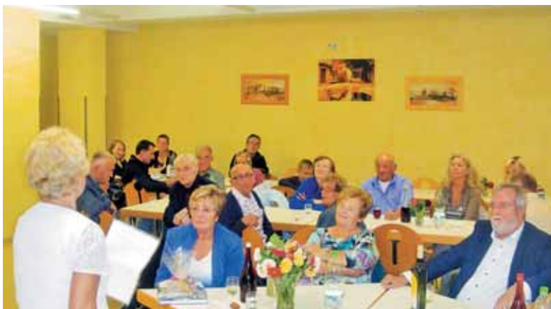
Nobeno slovo ni lahko, četudi se človek vrača v domovino.