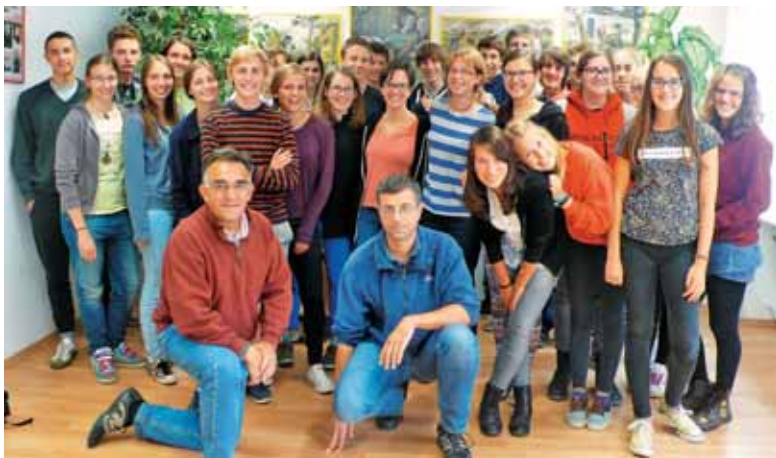
3. letnik ŠKG z razrednikom in voditeljem ekskurzije