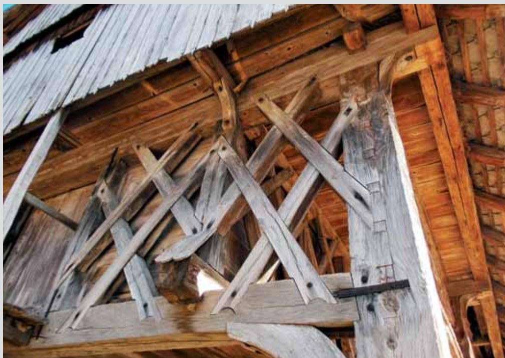
Slovenski kozolec, foto: Janez Rihar

Janez je odšel na fronto in po nekaj tednih poklical ženo: »Ljubica, veselo novico ti moram povedati.«