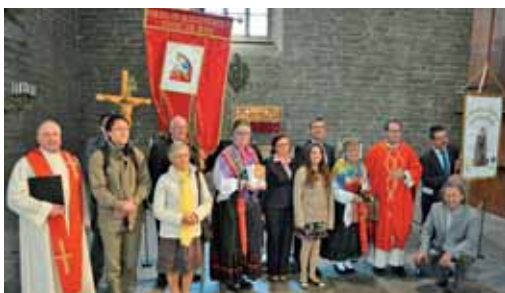
Naši gostje pri sv. Brigiti Švedski