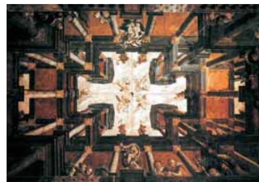
Celjski strop, detajl