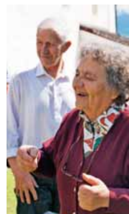
Zakonca Starman sta nas nagovorila s svojim pričevanjem.