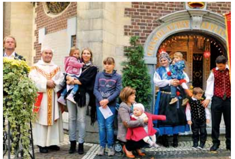
V Kevelaerju pred kapelo leta 2013