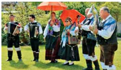
Dobrodolnica romarjem v Vadsteni