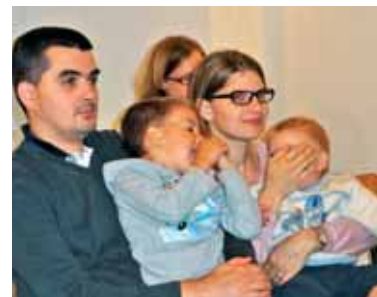
Nedeljska maša utrjuje in krepi družino.