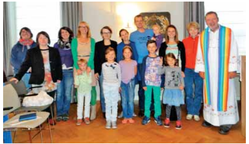
Po maši v Haagu

V soboto, 5. septembra, je bila slovenska maša v cerkvi sv. Bonifacija v Haagu. Potekala je v znamenju eksodusa beguncev z Bližnjega vzhoda in severne Afrike. Kot nalašč je božja beseda 23. nedelje med letom poročala o Jezusovem bivanju v Transjordaniji, sedanjem Libanonu, južni Siriji, Golanski planoti,