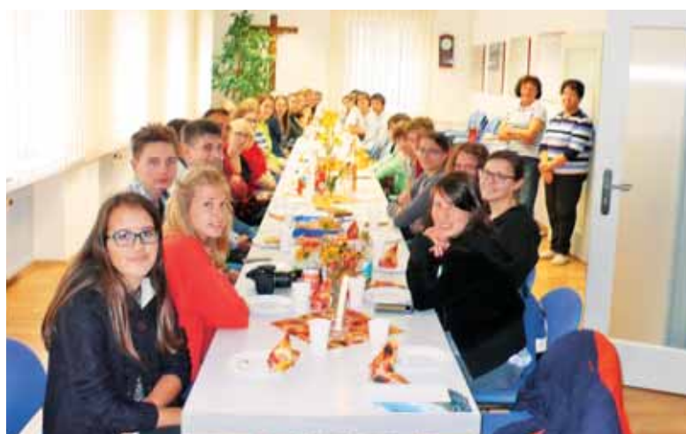
Dijaki ŠKG pri okrepčilu na slovenski misiji v Augsburgu