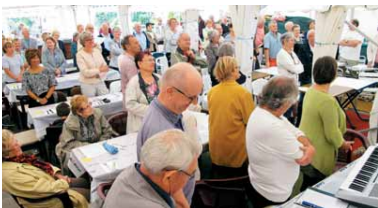
Pod šotoroma se nas je preko 150 zbralo vedrega obraza k skupni daritvi ob 10. uri.

sebe v odrešenjskem načrtu božje ljubezni. O Mariji ne govorimo, da je umrla, temveč spoštljivo govorimo o njenem spanju in vnebovzetju. To izredno spoštovanje je posledica njene prvenstvene naloge pri božjem posegu in svet po svojem Sinu. Letos je za pevsko povezavo poskrbel združeni pevski zbor okoliških župnij s sedežem v Herynju pod vodstvom gospe Cortesi. Skopih 120 nas je ostalo na skupnem romarskem kosilu, ki je bilo za mnoge priložnost novih srečanj in osebnega pogovora. Sedemčlanski orkester je popestril popoldan in vnesel mnogo veselja in lepega petja. Pridne gospodinjne so napekle vsakovr-