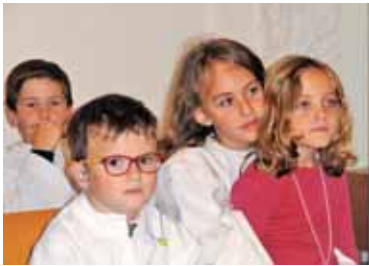
Kako naj pomagamo begunskim otrokom, smo se vprašali pri prvi maši v novem šolskem letu v Bruslju.

prvoobhajancev dejansko postane Jezusova družina. Jezus pride v njihovo sredo in želi prebivati z njimi.