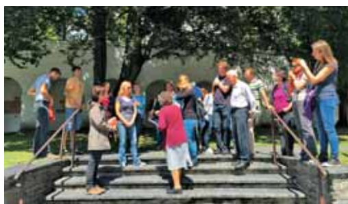
Mladi so napeto prisluhnili pričevanju.