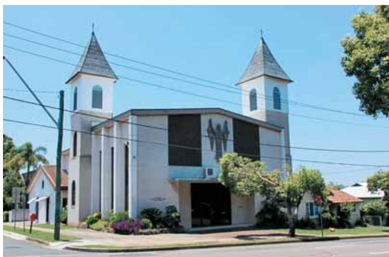
Sydney – Merrylands, slovenska cerkev sv. Rafaela, zgrajena 1971-1973

Prvi Slovenci so prišli v Avstralijo že pred letom 1900. To so bili predvsem mornarji, ki so služili v tedanji avstro-ogrski mornarici. Takrat so bili Slovenci še redki. Nekaj več jih je prišlo pred drugo svetovno vojno, prvi veliko večji val priseljencev pa imamo po drugi svetovni vojni zaradi političnih razlogov in tudi ekonomskih razlogov, ki prevladujejo še naslednja desetletja, tam od leta 1950 do 1970 ali kaj čez. Potem se je priseljevanje nekako ustavilo, v zadnjih letih, ko je svet v ko-