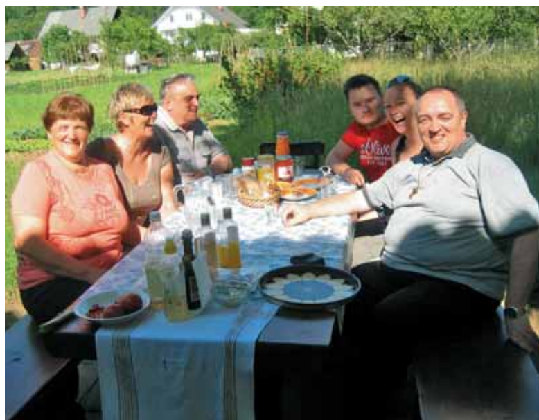
Med domačimi je vedno lepo ... piknik v Sebnjah ob očetovi 75-letnici.