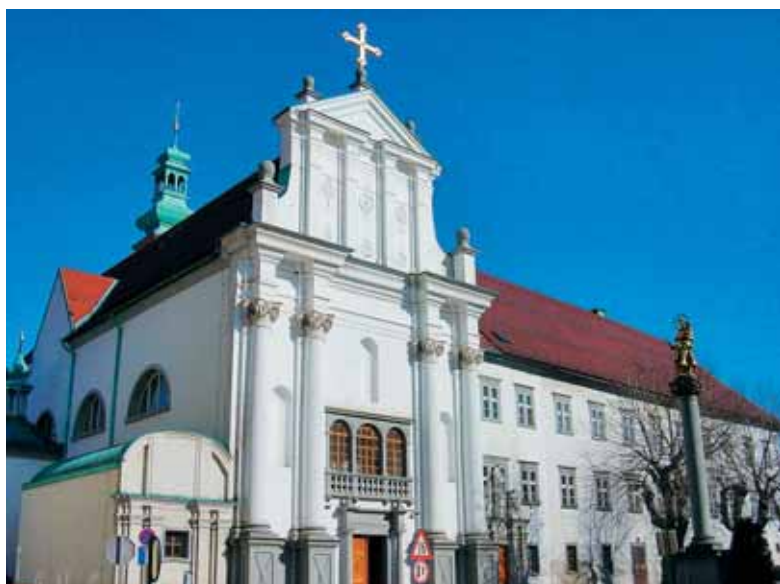
Samostanska cerkev sv. Petra in Pavla