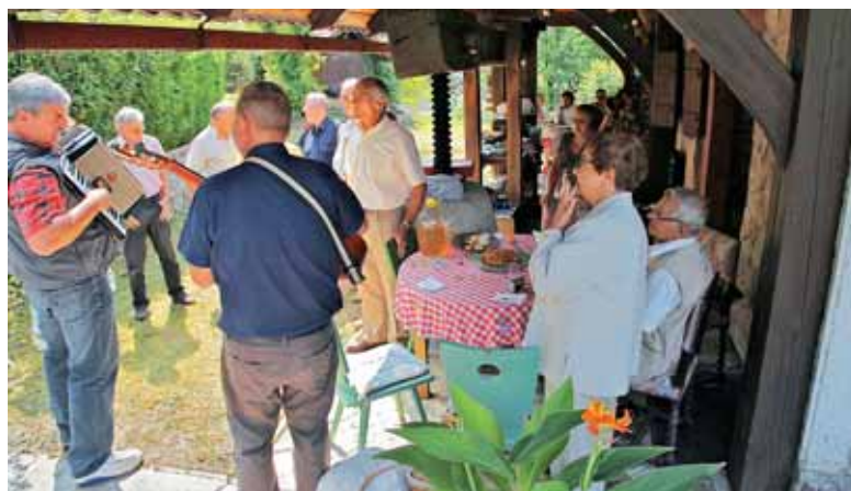
V objemu Gradišča nad Trebnjem so se združili dopustniki iz vzhodne in osrednje Francije.