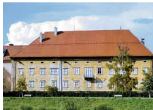
Celje, Stara grofija

renesanse v zgodnji barok. Ob odkritju je bil ves natrgan in počrnel, vendar ga je na konservatorjevo željo akademski slikar Matej Sternen temeljito očistil in restavriral. Njegova velikost, ki zavzema