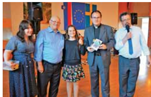
Spominski posnetek organizatorjev tombole z voditeljem slovesnega bogoslužja za binkošti v Vadsteni