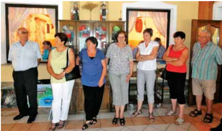
Naši rojaki na srečanju v domovini