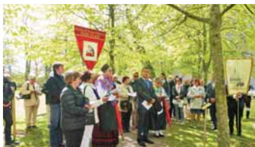
Slovenska pesem Lipa zelenela je pri slovenski lipi v Vadsteni