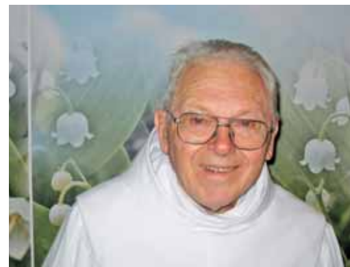
Biserma maša p. Valerijana

Slovenci so tukaj radi in velikodušno pomagali, ustvarili nove družine, vezi in vezi občestva. Lepi in živi so spomini, ko pogledamo prehojeno pot in se pogovarjamo ob obiskih in sicer. Imamo redne sodelavce, člane pastoralnega sveta in druge prostovoljce, vendar marsikateri zdaj težje pomagajo ali ne morejo več, veliko je že pokojnih, mladi pa so vse manj navzoči v naših občestvih, ker so že bolj vključeni v avstralsko družbo, šole in župnije, težje jih dobimo za sodelovanje in tudi vidijo marsikaj z drugačnimi očmi kot pa starejši. Nekatere prireditve, ki smo jih pripravljali, smo morali žal opustiti. Seveda pa ne manjka tistih skritih žrtev in molitev naših rojakov, med njimi bolnih in ostarelih, na katere prav tako ne smemo pozabljati.