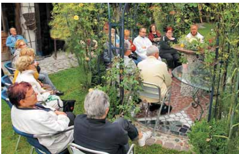
Ob Njej smo v večerni uri ostali kot molitveno občestvo, kot Njeni otroci.