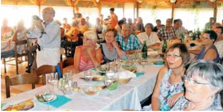
Srečanje v moji domovini 2015