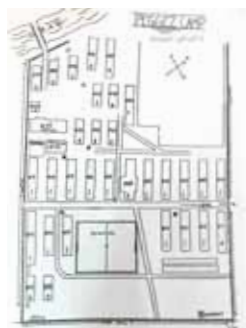
Zanimivo si je bilo ogledati načrt taborišča v Peggetzu.