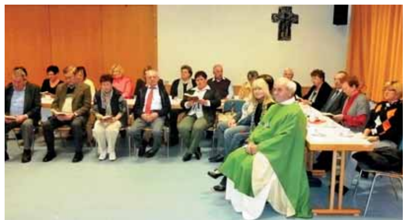
Iz arhiva - maša v dvorani v Krefeldu v okt. 2011