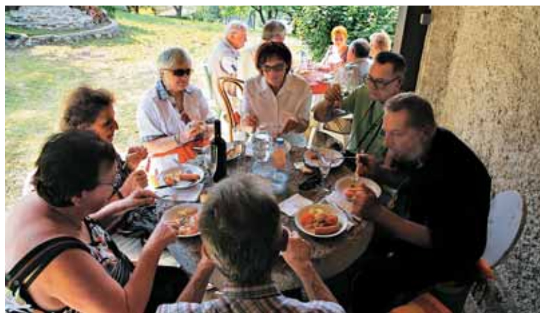
Kamnito mlinsko kolo je mlelo človeško besedo in potešilo lakoto.