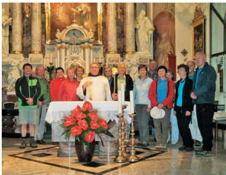
Tržič, blagoslov romarjev pred odhodom na romanje v Glinje na Koroško, maj 2014

V duhovniškem delu me poleg božjega spremstva in varstva in delovanja Svetega Duha najbolj navdihujeta naša ustanovitelja sv. Frančišek in sv. Klara, poleg njiju pa sv. Avguštin. Vzornikov je še nekaj, potem ustvarjaš svojo vizijo in umetniho. Vizija je velika, načrti se vedno ne izidejo, zato moramo še bolj iskati božjo voljo, čeprav bi hoteli kdaj drugače. »Ko dobro delamo, ne omagujmo, kajti ob svojem času bomo želi, če ne opešamo« (Gal 6,9), nas spodbuja sveti Pavel. Če kdaj ne gre takoj, če mora kakšna zadeva ali čas dozoreti, uporabimo čas še za druge stvari in ljudi, postorimo, opogumimo in razveselimo. Naša največja težava je namreč večkrat ta, da hočemo uspehe ali čudeže takoj, kot bi pritisnili na gumb v kuhinji ali v avtomobilu. Toda Bog daje rast in sad ob svojem času in marsikaj obrne v dobro, ko še mi ne pričakujemo, in to nam je v veselje.