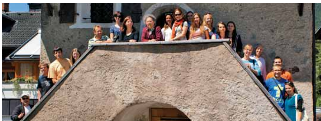
Mladi, ki so romali po poteh slovenskih beguncev.