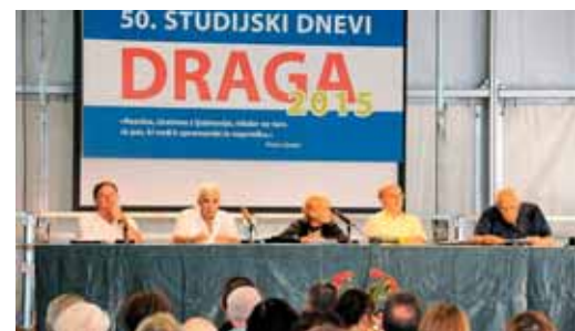
50. študijski dnevi Draga 2015