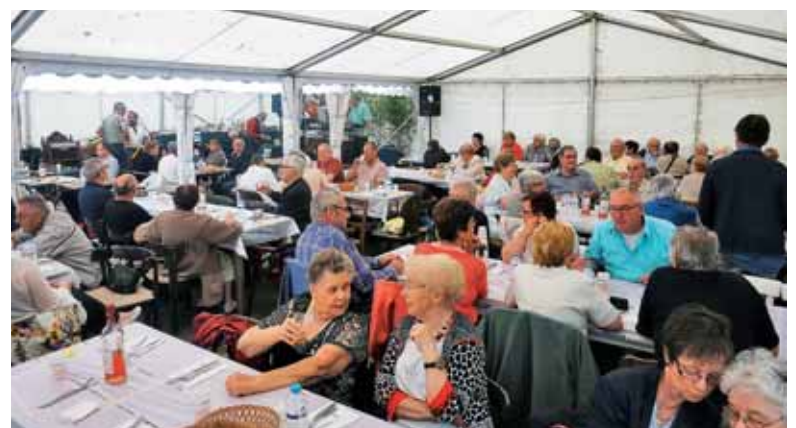
Za kosilo jih je bilo še vedno preko sto pod taktirko dežnih kapelj, a slastnih jedi.