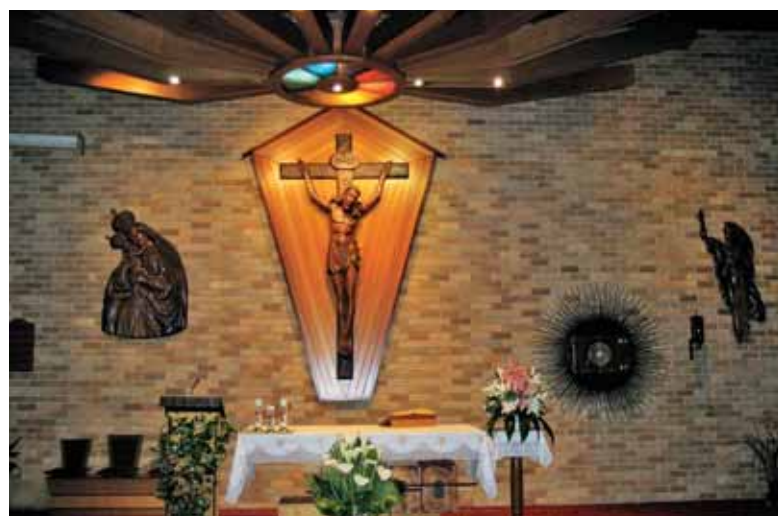
Glavni oltar v cerkvi sv. Rafaela